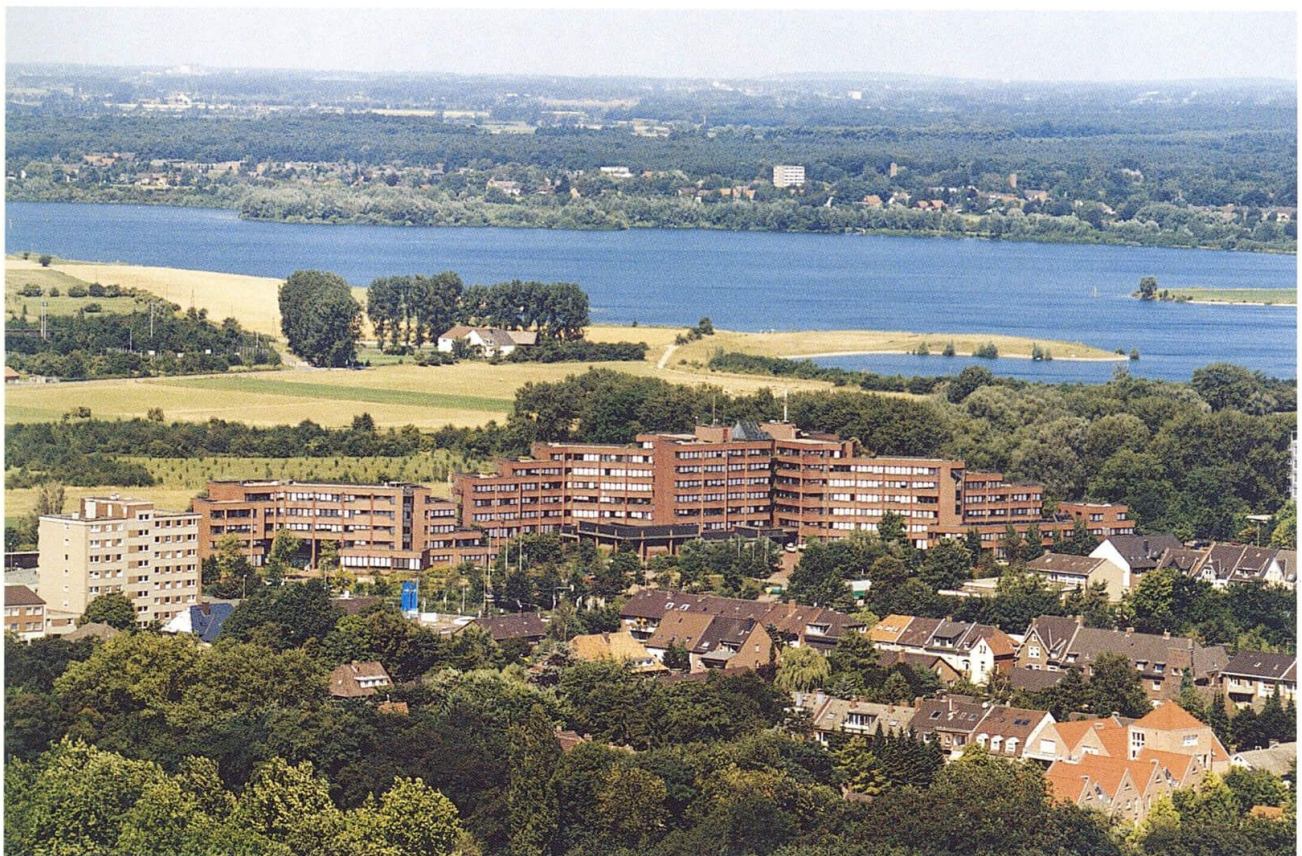
Kreishaus in Wesel